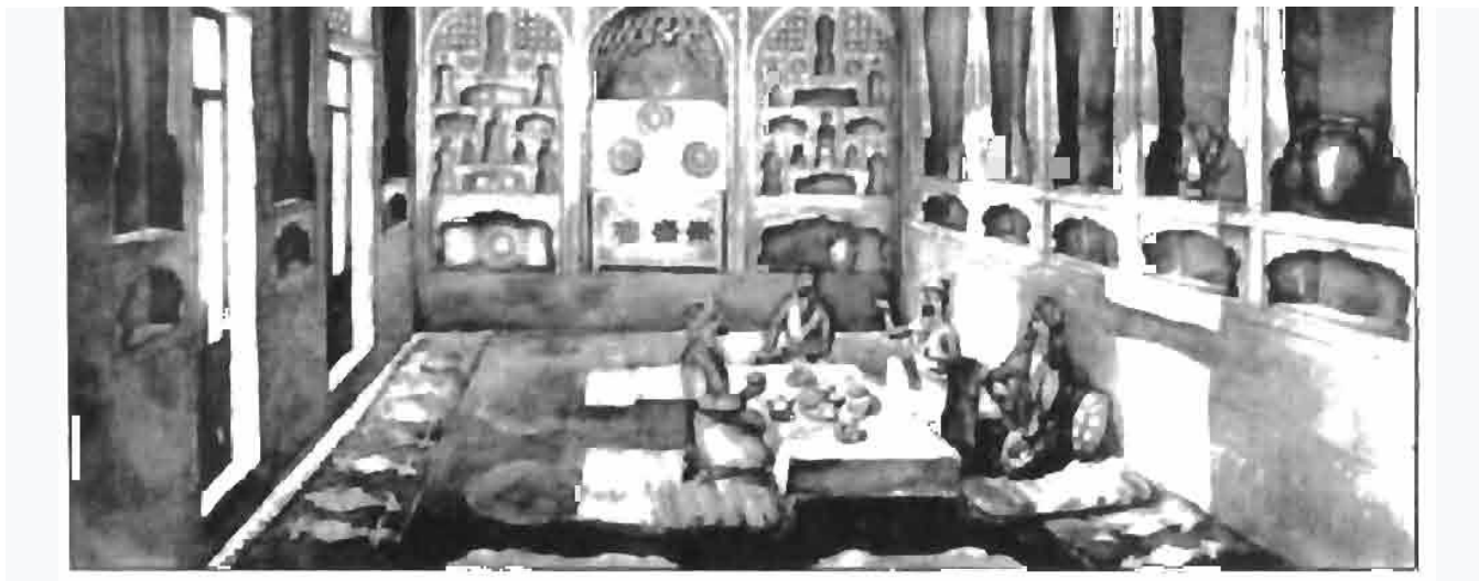
рис. 2. Комната михманхана в Самаркандских жилищах

В Самарканде местная традиция была прервана запустением города в XVIII веке, а пришлое вслед за тем население принесло разных городов приемы последних, поэтому образ жилища не обладает в Самарканде цельностью. Тем не менее можно дать достаточно отчетливую общую характеристику его особенностей. В планировке самаркандского дома употребляется сочетание на одной или двух комнат и узкой передней (рис. 3).