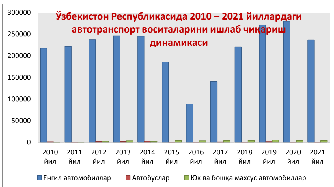
1-расм. Ўзбекистон Республикасида 2010 – 2021 йиллардаги автотранспорт воситаларини ишлаб чиқариш динамикаси

Тадқиқот натижалари шуни кўрсатдики, Ўзбекистонда 2010 – 2021 йилларда автотранспорт воситаларини ишлаб чиқариш ҳажм жиҳатдан динамик тарзда ўзгарган (1-жадвал).