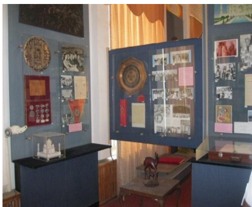
Sharof Rashidov yodgorlik muzeyi.