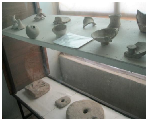
Jizzax v. O'lkashunoslik muzeyi.

Xulosa qilib aytadigan bo'lsak, muzeylardagi har bir qo'lyozma va moddiy-ashyoviy boyliklar har bir shaxs qalbida, ayniqsa, yosh avlod qalbida tarixga bo'lgan qiziqish hamda vatan tarixiga bo'lgan hurmatni yuksaltiradi. Xususan, Jizzax viloyati O'lkashunoslik muzeyining Tarix bo'limidagi noyob eksponatlar muzeyga tashrif buyurayotgan har bir inson qalbida ushbu ashyolarga qiziqish uyg'otadi va bu insonlar eksponatlarning paydo bo'lish tarixini bilishga intiladi. Hozirda yurtimizdagi