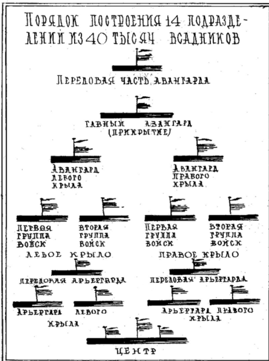
Порядок построения 14 подразделений из 40 тысяч всадников

Легкие войска и передовой авангард начинали сражение; начальник главного авангарда подкреплял их и вводил в бой свои войска, если требовалась помощь, постепенно наращивая усилия вводом в бой первой, затем второй линии. Если и этих подкреплений было недостаточно, то правое и левое крылья резерва, то есть сыновья, внуки, родственники и союзники Амира Темура вступали в бой.