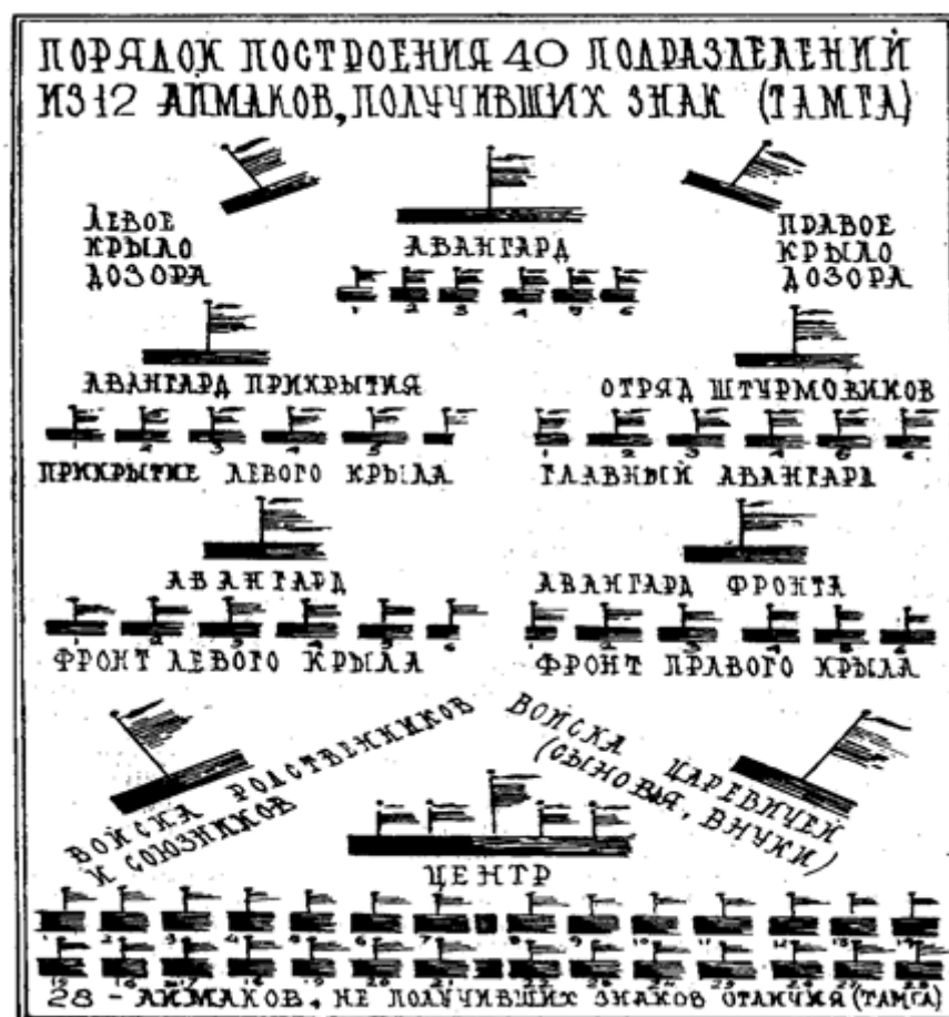
Порядок построения войска из 40 подразделений

Созданное Амиром Темуром войско по своей организационной структуре хотя и было близко к системе структуры войска Чингизхана, однако имело следующие основные особенности.