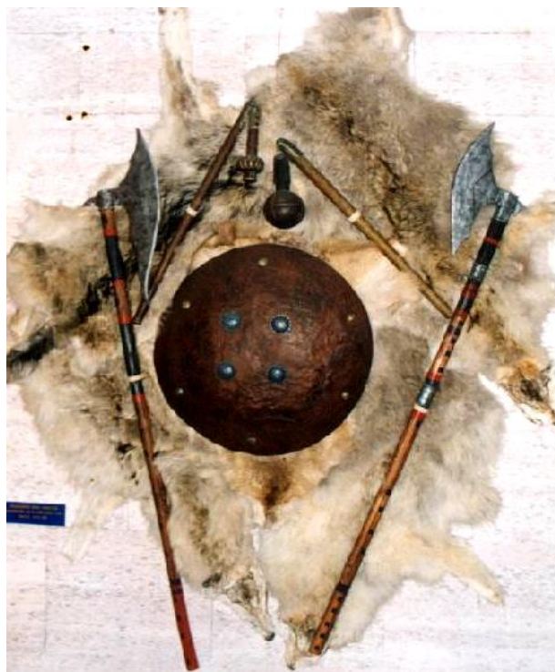
Оружие воинов армии Амира Тимура

Для боя выбиралось большое и ровное поле, при этом обращалось внимание на то, чтобы недалеко была вода и подножный корм, чтобы солнце не светило в глаза. Боевой порядок рассредоточивался по фронту и особенно в глубину. За счет ослабления центра