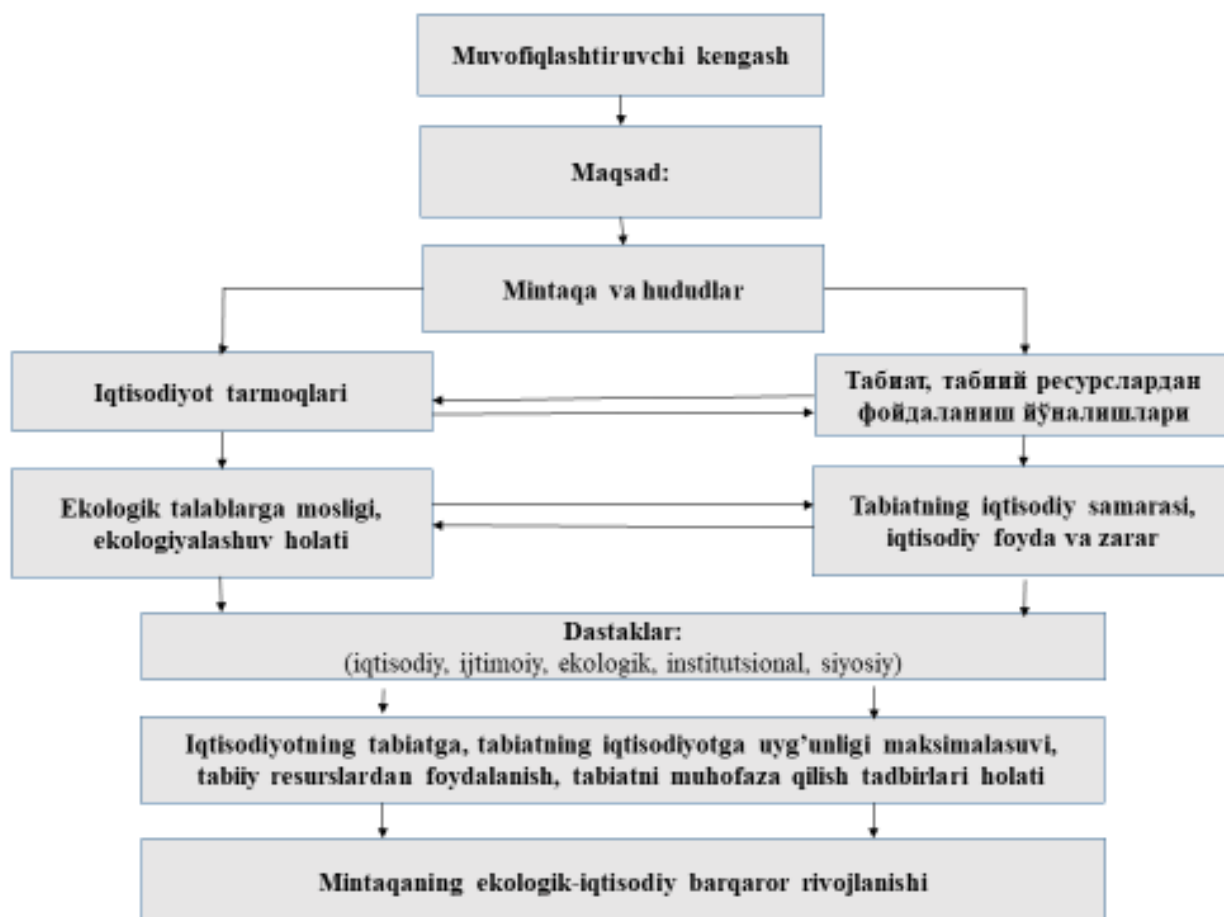
2-rasm. Hududiy ekologik-iqtisodiy barqaror rivojlanishni muvofiqlashtiruvchi kengash

Ekologik menejmentning umumiy qonuniyati quyidagi uchta asosiy umumiy ekologik boshqaruv tamoyilini belgilaydi: ekologik boshqaruvda tabiatning ustunligini hisobga olish tamoyili, ekologik boshqaruvda tabiatni ijtimoiylashtirishni hisobga olish tamoyili, ekologik boshqaruvda ishlab chiqarishni ekologiyalashuvini hisobga olish tamoyili.