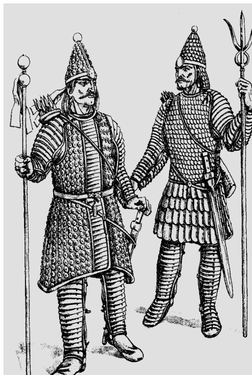
Кушанские цари в боевом облачении (с монет Канишки III и Васудевы)

Опорой кушанского государства считалось многочисленное и хорошо вооруженное войско.