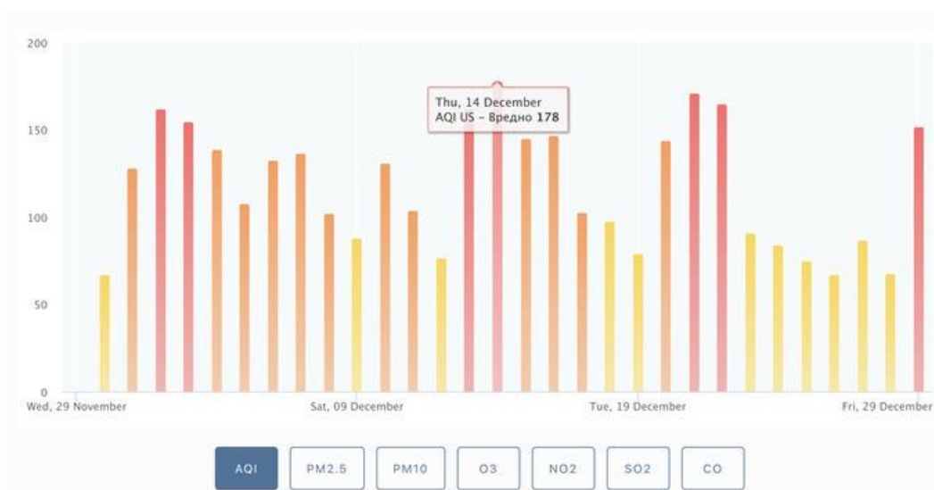
1-rasm. PM 2,5 bo'yicha havo sifati indeksi (AQI) ko'rsatkichlari [47].