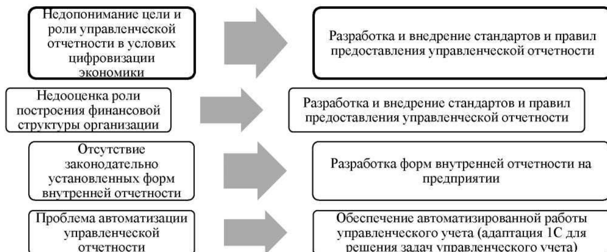
Рис. 2. Проблемы формирования управленческой отчетности и направления их решения

Также выделяются виды внутренней отчетности по целям предоставления, по пользователям информации (акционерам, собственникам, менеджерам, работникам и т. д.) и по особенностям деятельности (операционные и географические сегменты деятельности, применяемые системы налогообложения в группе компаний и др.). Содержание и сущность всех видов управленческой отчетности влияют на деятельность хозяйствующего субъекта путем оценки, контроля, прогнозирования и планирования работы его отдельных структурных подразделений. Анализ литературных источников позволяет выявить ряд проблем, из-за которых многие предприятия не могут обеспечить полноту представляемой информации в управленческой отчетности (см. рис. 2).