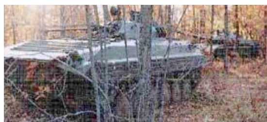
Пиёдалар жанговар машинасининг ёлгон макетлари